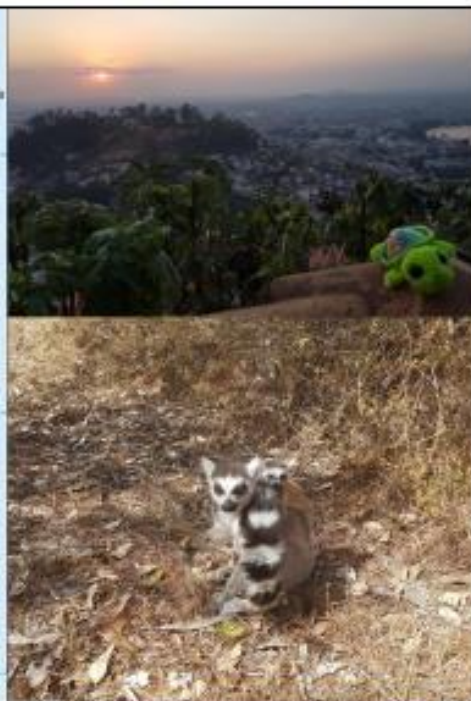
Carte de Madagascar, coucher de soleil et lémurien avec son petit.