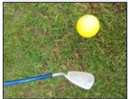
Un club (un fer) et la balle.