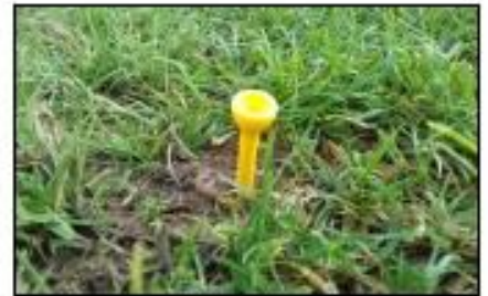
Le tee planté dans l'herbe.